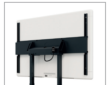
Displayspezifisch optimierte TV-Aufnahme